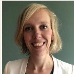
Christa Monster Ministerie Justitie & Veiligheid