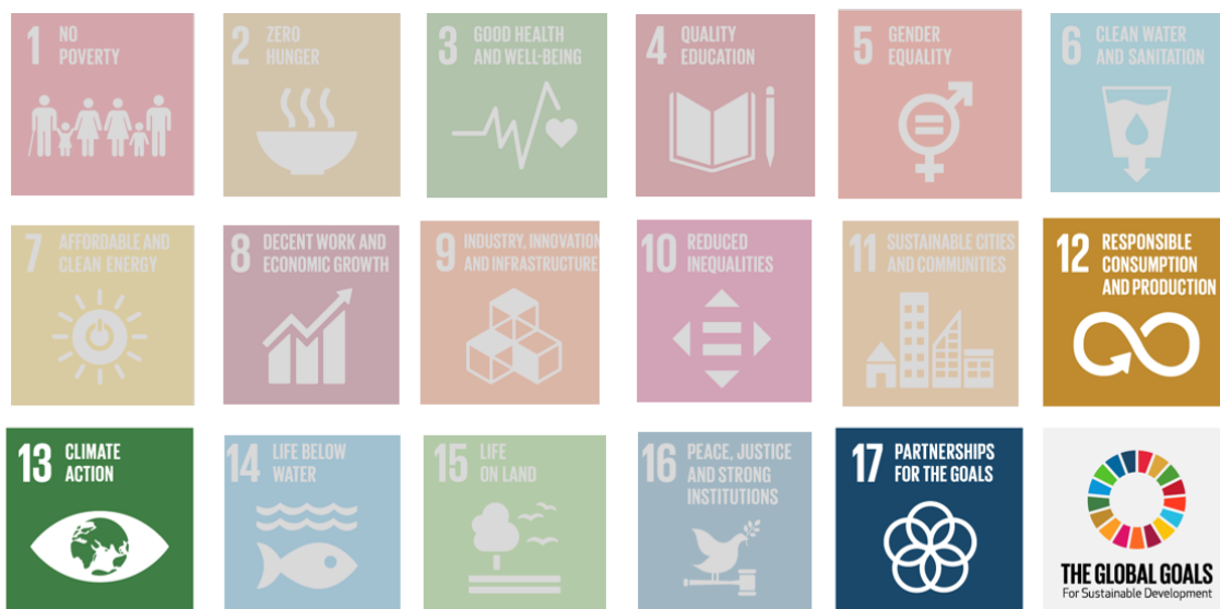
Figuur 1: SDG's van de Verenigde Naties

Daarnaast heeft Nederland in 2016 het klimaatakkoord van Parijs ondertekend als één van lidstaten van de Europese Unie. Dit akkoord is nauw verbonden met de SDG's, beide akkoorden zijn gericht op 2030 en bevatten doelstellingen op gebied van klimaatneutraliteit. Hierbij is het Klimaatakkoord van Parijs gericht op het reduceren van de CO 2 -emissie met 40% in 2030. Mede op basis van het klimaatakkoord heeft de Europese Commissie (EC) eind 2018 een Europese langetermijnvisie voor een klimaat neutrale economie in 2050 gepubliceerd. Op vier Oost-Europese landen na steunen de EU-landen het door de EC beschreven tijdsplan.