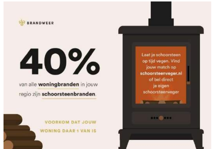
Flyer veilig stoken