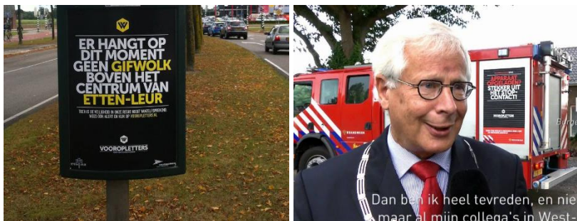
Voorbeeld Midden West Brabant: communicatie gemeentelijke abri's in samenhang met bestickering voertuigen.