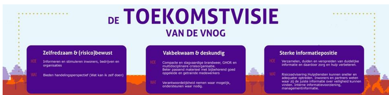
Figuur 1. Toekomstvisie van de VNOG – visualisatie van de drie beleidspijlers

Op 15 januari 2020 is de Toekomstvisie VNOG vastgesteld. Hierin staat centraal staat dat de VNOG een regio wil zijn waar veilig gewoond, gewerkt en gerecreëerd kan worden. Door in te spelen op demografische en maatschappelijke ontwikkelingen die van invloed zijn op de hedendaagse en toekomstige veiligheidsrisico’s is de VNOG een toekomstbestendige Veiligheidsregio. Er zijn drie beleidspijlers opgenomen in de toekomstvisie voor de beleidsperiode 2021-2024.